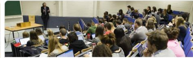
CORAL (NL) - Compréhension du discours oral ... [ILV] Institut des langues vivantes