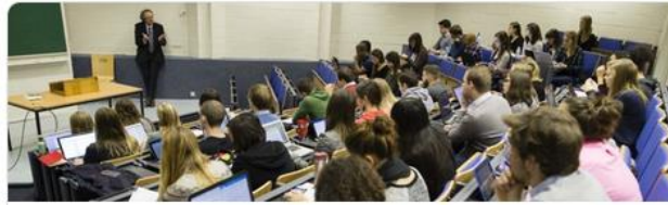
CORAL (FR) - Compréhension du discours oral ... [ILV] Institut des langues vivantes