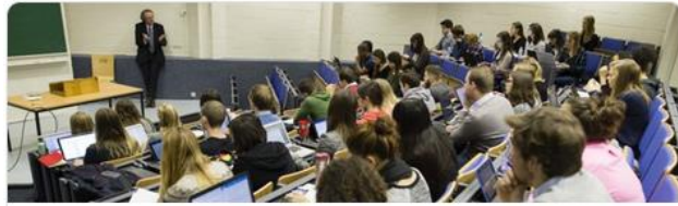
CORAL (Eng) - Compréhension du discours oral ... [ILV] Institut des langues vivantes